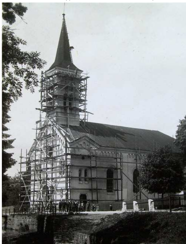
Oprava kostela v roce 1932. Tenkrát stála 16607,60Kč. V brzké budoucnosti plánovaná oprava střechy věže bude o něco dražší... :-)